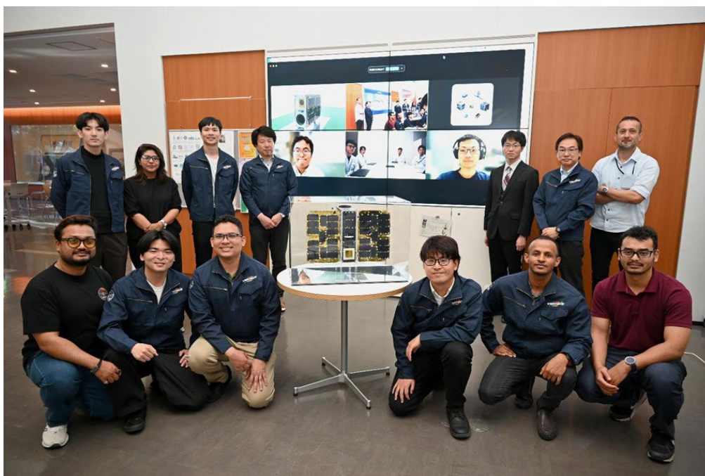
VERTECS プロジェクトメンバー

この度、超小型衛星「VERTECS*」の完成を記念し、お披露目会を、2026年5月14日、九州工業大学戸畑キャンパスで開催しました。