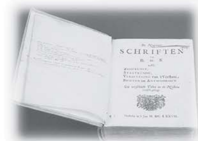
オランダ語版 "De nagelate schriften van B. d. S." 1677