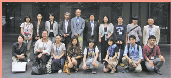
第23回学生選書モニター参加者

6月21日(土)にジュンク堂書店大阪本店にて学生選書モニターを実施しました。選書冊数は全422冊。その中から、既に図書館で所蔵しているものなどを除いた249冊を受け入れました。選ばれた本は、学生選書図書コーナーにあるファイルで確認できます。