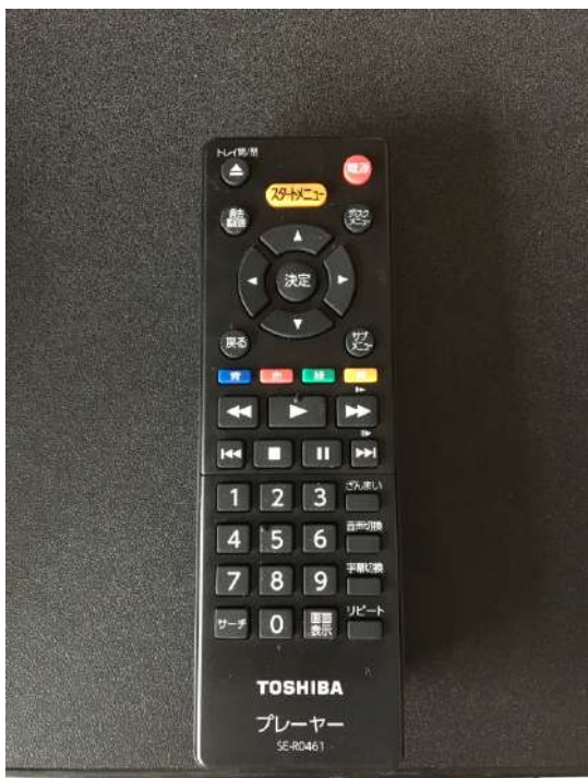
ブルーレイデッキ