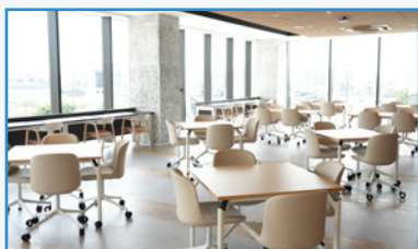
コモンズ(地域コミュニティ)