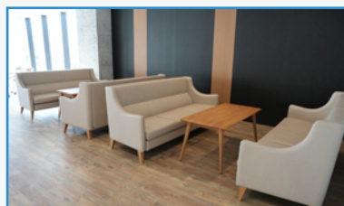
コモンズ(地域コミュニティ)