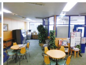
ラウンジ (約144平方メートル) ・テーブル個数: 4個 ・椅子個数: 20脚 ・50インチ液晶テレビ ・DVDプレイヤー